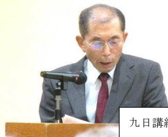
九日講組飴野会長